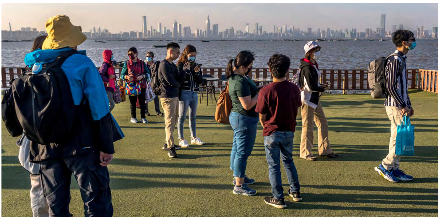
ROMBONGAN TURIS mengunjungi Deep Bay sembari memandangi cakrawala Shenzhen yang ada di seberang Hong Kong.