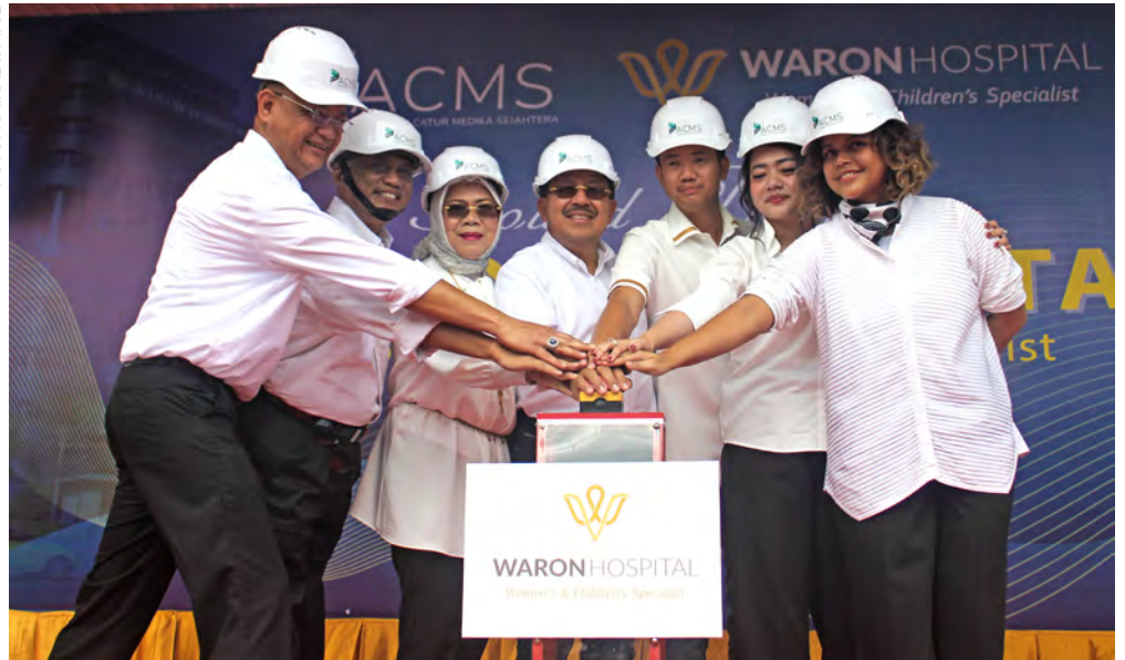
JAJARAN direksi dan komisaris Waron Hospital yang bersemangat saat menekan tombol bersama-sama sebagai simbolisasi peletakan batu pertama RSIA yang ditargetkan berdiri pada April 2024.