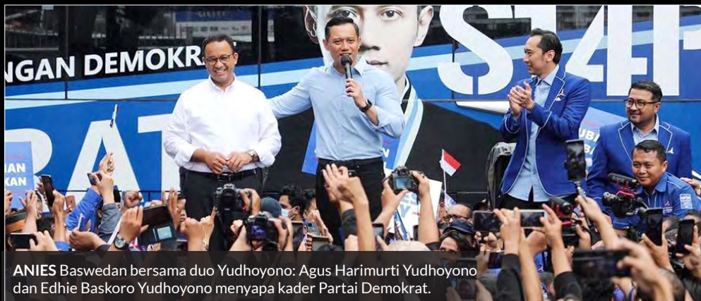
ANIES Baswedan bersama duo Yudhoyono: Agus Harimurti Yudhoyono dan Edhie Baskoro Yudhoyono menyapa kader Partai Demokrat.