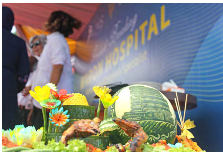
KEUNIKAN ukiran di kulit semangka yang menghiasi tumpeng pelaksanaan ground breaking, menggambarkan detail tampak depan bangunan Waron Hospital.

Sebagai RSIA di Surabaya, Waron Hospital Women’s & Children’s Specialist akan merekrut tenaga kesehatan spesialis dan sub spesialis dari negeri sendiri. “Sebab ini murni karya anak bangsa. Jadi pasti kami hadir untuk menjadi rujukan bangsa sendiri. Bila mana tidak mampu dan butuh layanan BPJS, pasti tersedia. Tidak perlu lagi keluar negeri. Kita punya ahlinya di sini,” ucap Amang dan Rudi yang saling melengkapi. (Heti Palestina Yunani-Dara Nabila S)