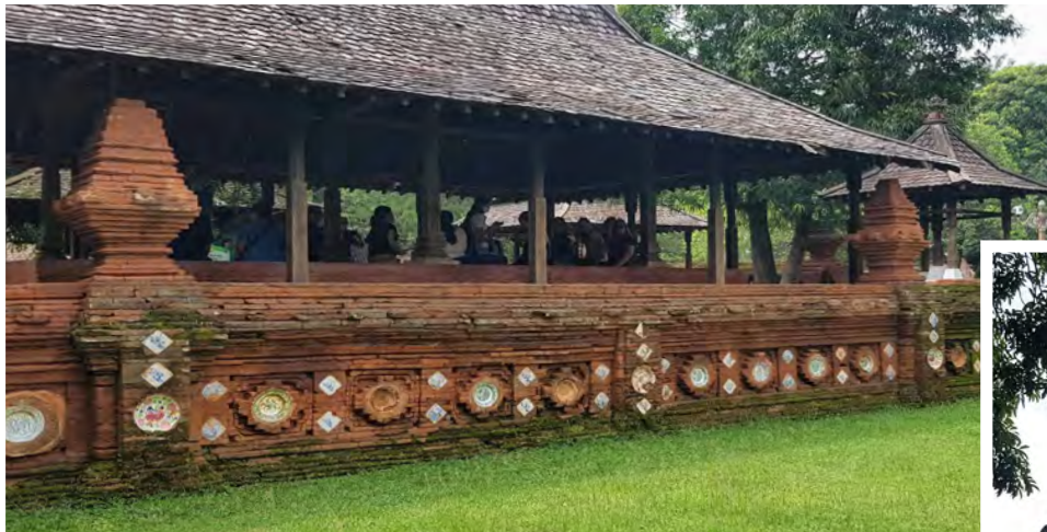
▶ PULUHAN piring bermacam motif dari Tionghoa menjadi ornamen pagar Keraton Kasepuhan. Bersanding dengan keramik-keramik berbentuk segi empat dari Belanda.

pada 1471, Sunan Gunung Jati pergi ke Tiongkok. Atas undangan Kaisar Hong Gie. Putri kaisar, Ong Tien Nio, jatuh cinta pada pemuka agama yang tampan dan berwibawa tersebut. Dia minta dinikahkan dengan Sunan Gunung Jati. Tapi sang ayah tidak mengizinkan.