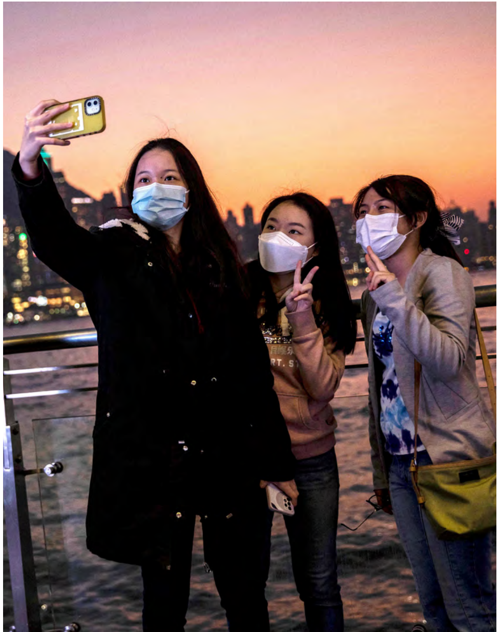
PEREMPUAN BERSWAFOTO setelah matahari terbenam di Victoria Harbour, Hong Kong, 30 Desember 2022.

Yang menurut Melissa tidak fair adalah, tiket justru diperebutkan oleh orang-orang mampu. ”Bukanlah lebih baik diundi berdasar data member. Daripada rebutan adu cepat seperti ini,” gerutunya. (Doan Widhiandono)