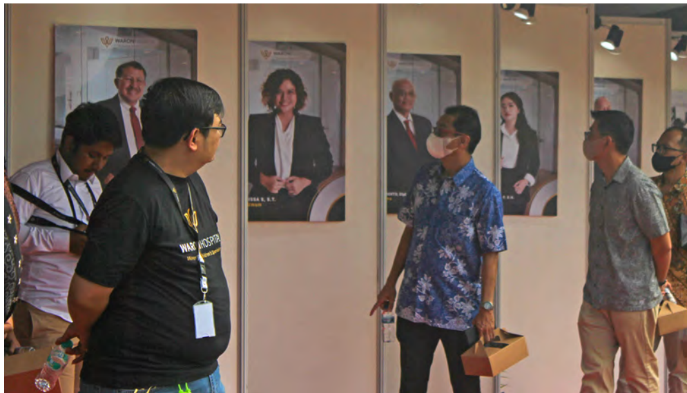
PARA HADIRIN menyaksikan profil pengenalan dari masing-masing jajaran direksi dan komisaris Waron Hospital.

Dalam kesempatan itu, Rudi, menjelaskan bahwa pembangunan