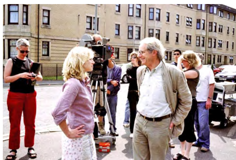
SUTRADARA Ken Loach (kanan) mengarahkan Eva Birthistle di lokasi syuting Ae Fond Kiss . Ia adalah sineas Inggris dengan gaya bertutur yang khas dan mengedepankan orisinalitas.

Kembali pada lapisan tadi. Begitu padatnya tiap lapisan menjadi