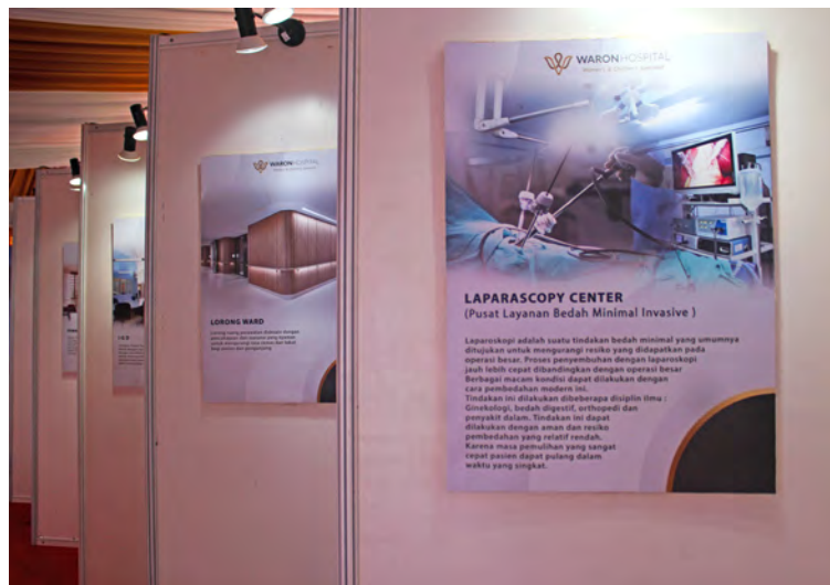
PAMERAN POSTER yang menjelaskan kepada para pengunjung acara ground breaking tentang berbagai fasilitas premium yang bakal tersedia di Waron Hospital nanti.

Sayang selama ini keluhan menyangkut hal tersebut selalu dirujuk ke rumah sakit umum saja. Inilah yang membuat spesialis obstetri dan ginekologi itu menyediakan tempat khusus. Ini mengingat Waron Hospital punya visi untuk menyediakan pelayanan kesehatan premium dengan standarisasi internasional.