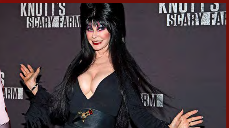
ELVIRA , bintang The Mistress Of The Dark berusia 73 tahun dengan nama asli Cassandra Peterson itu mengklaim bahwa Ariana Grande menghina saat panel tanya jawab di California beberapa tahun lalu.