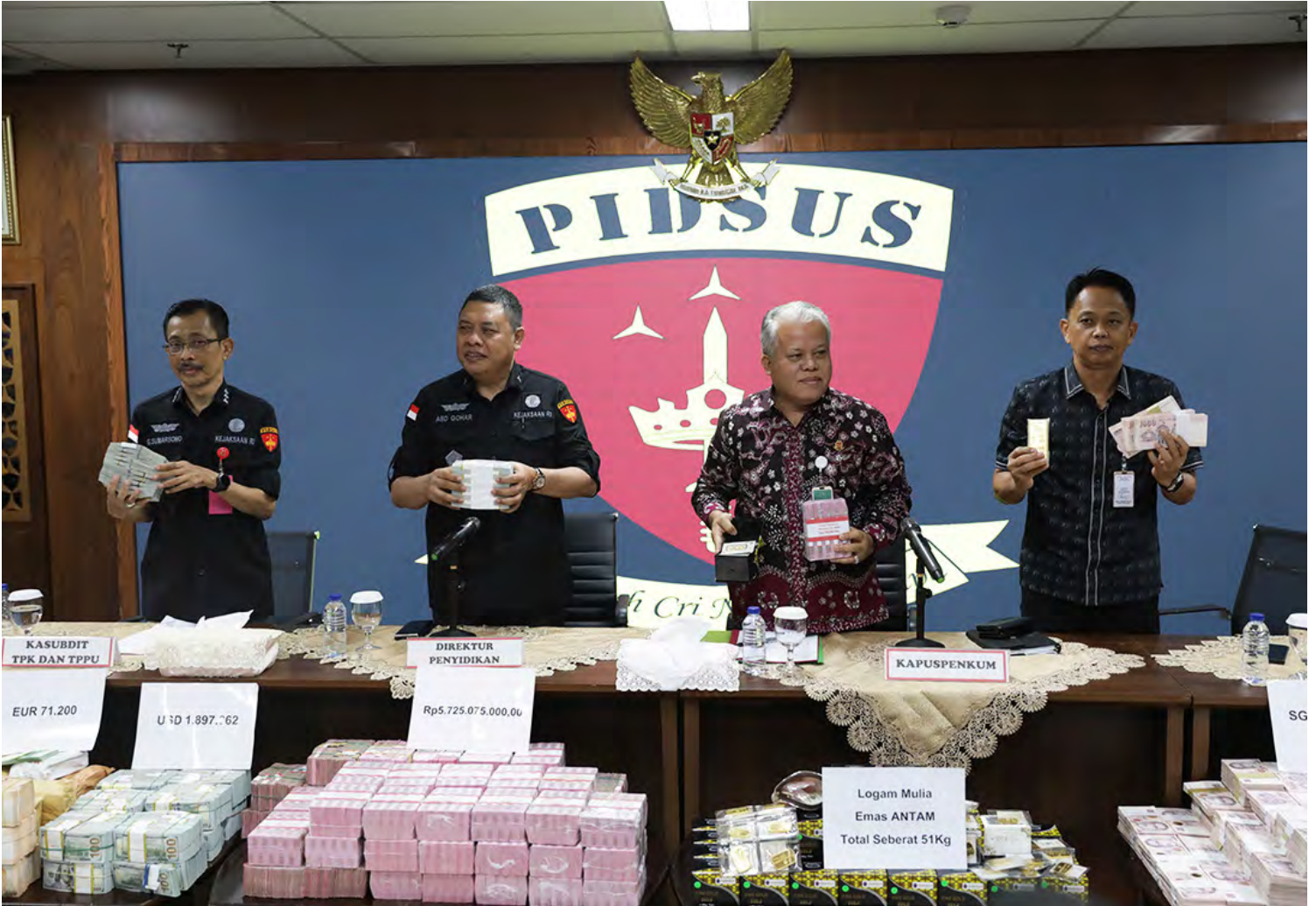
PENYIDIK menggelar konferensi pers dan menyita barang bukti uang tunai 74.494.427 dolar Singapura, 1.897.362 dolar Amerika Serikat, 71.200 Euro, 483.320 dolar Hong Kong, dan Rp 5.725.075.000 dan emas Antam 51 kilogram.