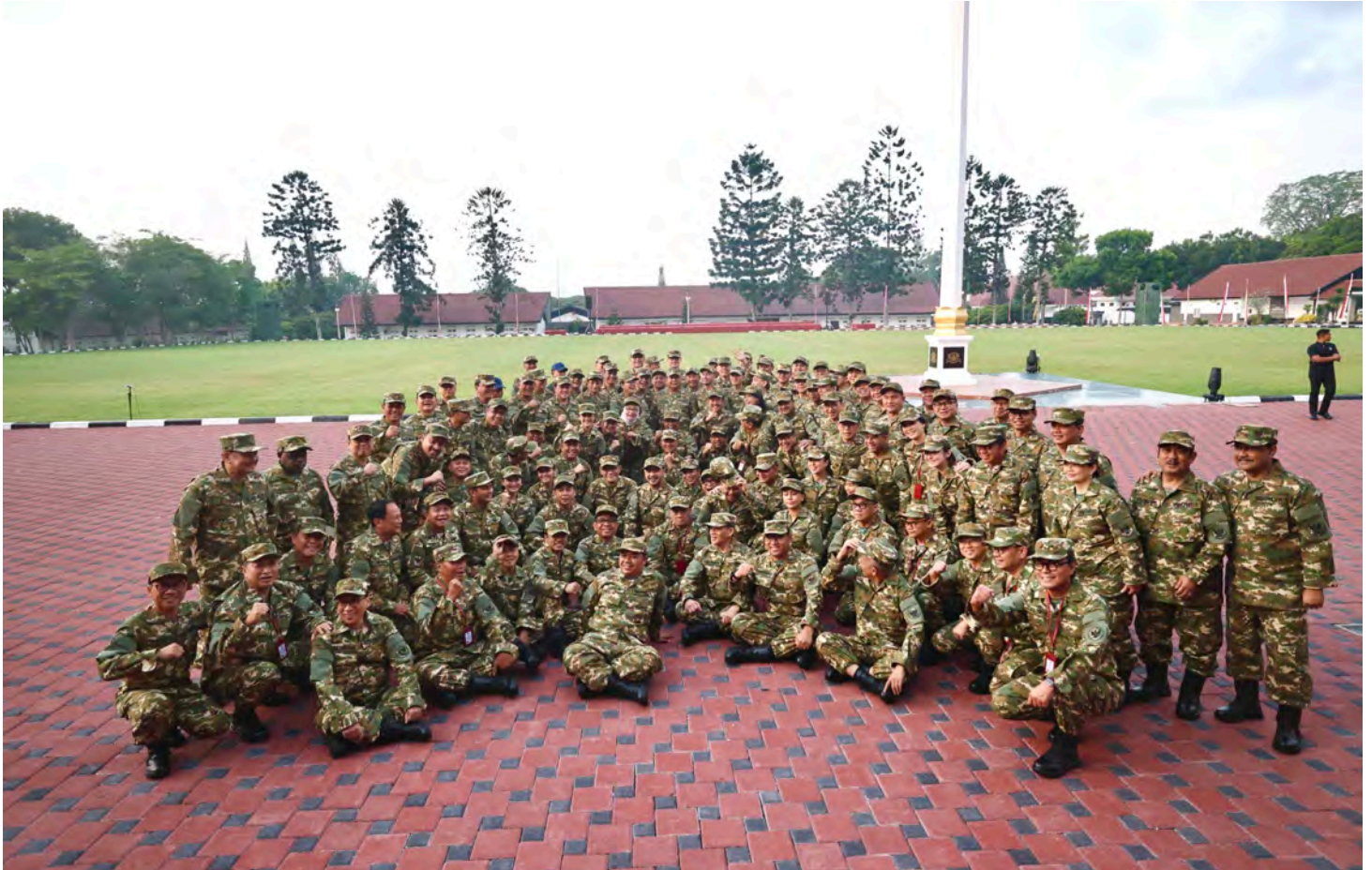
ANGGOTA KABINET MERAH PUTIH berfoto bersama mengenakan seragam doreng buatan Sritex di Akmil, Magelang.

T ENDA VIP yang dipakai para menteri di Magelang itu buatan PT Sritex Solo. Demikian juga baju dorengnya.