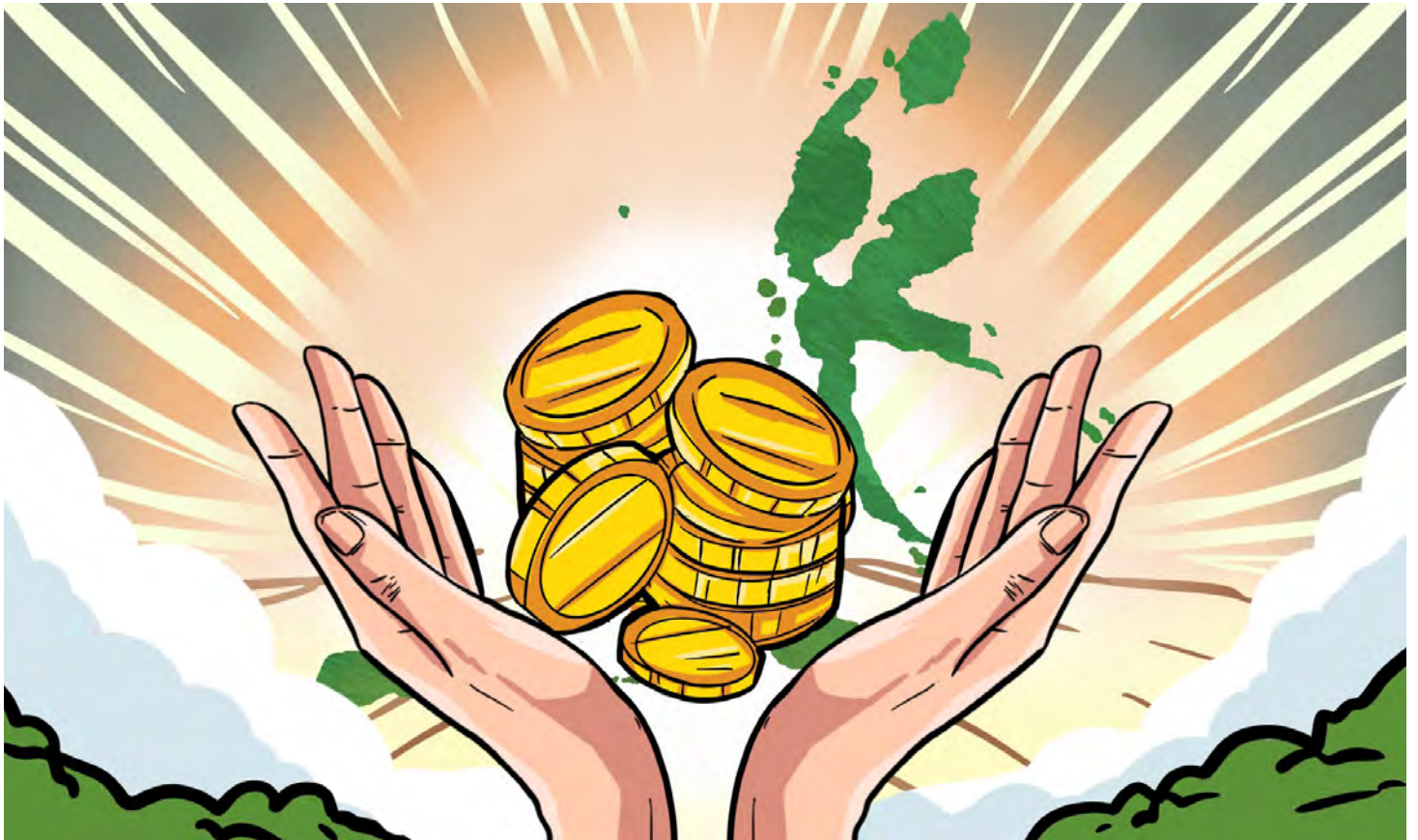
ILUSTRASI: GUSTI-HARIAN DISWAY

P ROVINSI Maluku Utara, yang terdiri atas banyak pulau yang kaya akan beragam sumber daya alam, saat ini sedang bergulat dengan tantangan serius dalam pengelolaan dan pengawasan yang efektif atas urusan keuangan daerah.