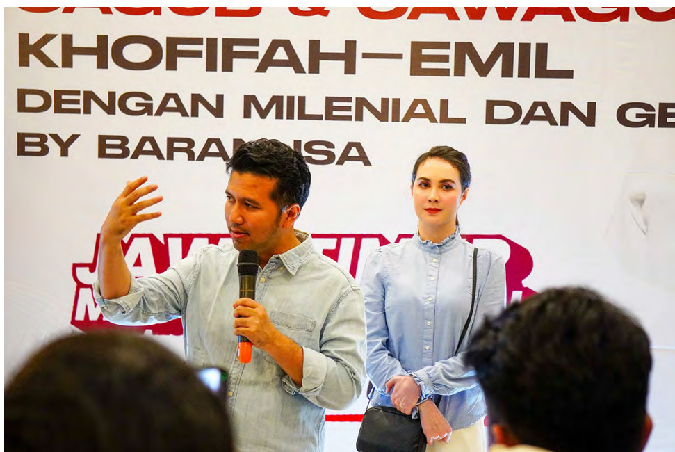
CALON WAKIL Gubernur Jatim nomor urut 2 Emil Elestianto Dardak baru saja menyapa relawan Barisan Rakyat Nusantara (Bara Nusa) Jatim.

Target kemenangan besar pun dilakukan oleh paslon nomor urut tiga: Tri Rismaharini-Zahrul Azhar Asumta. Sehari kemarin, Gus Hans melakukan kampanye di Bondowoso.