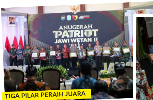
TIGA PILAR PERAIH JUARA