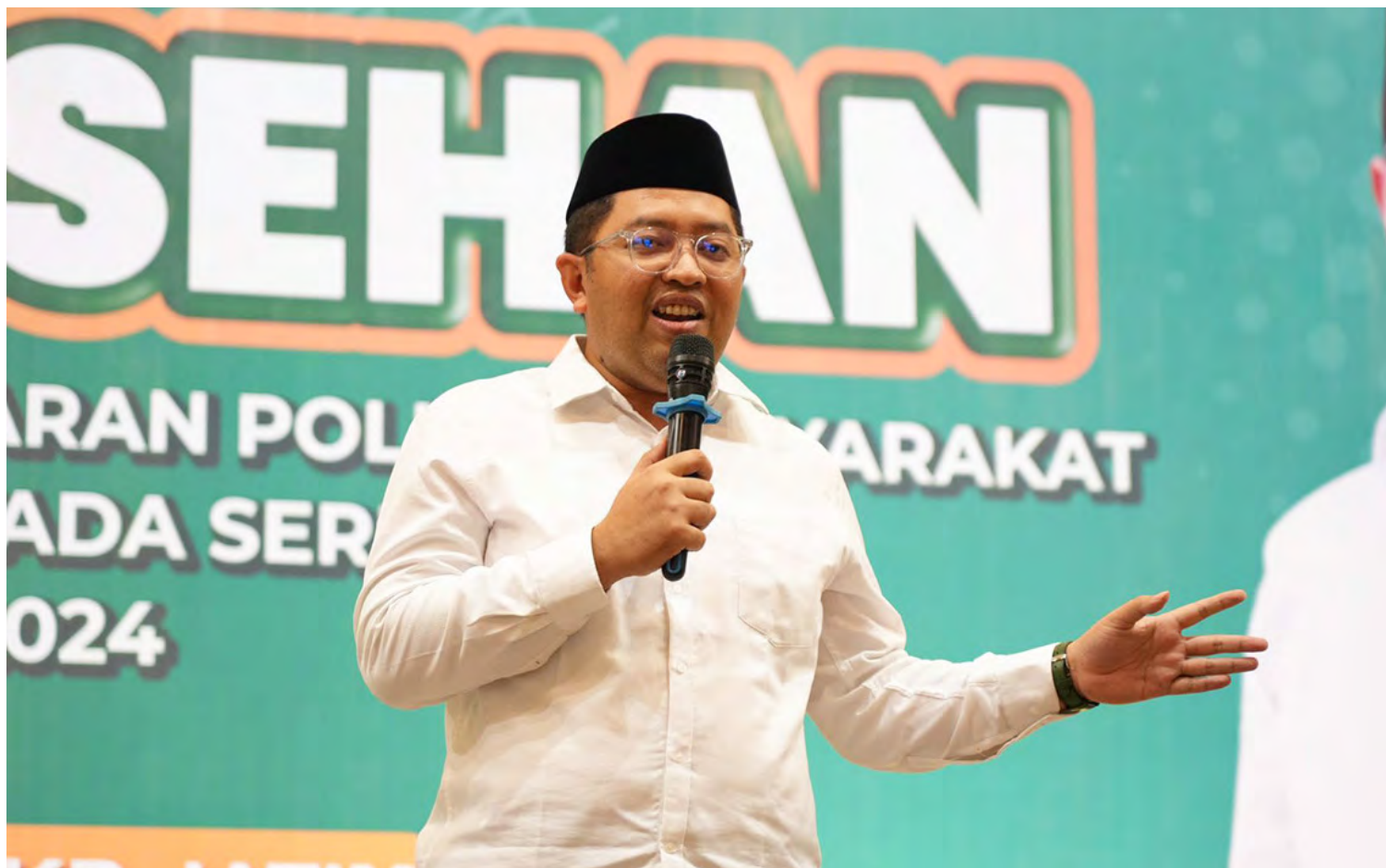
TIM KAMPANYE LULUK-LUQMAN