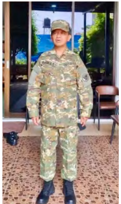
MENTERI ESDM Bahlil Lahadalia mengenakan seragam dorengnya.

Di persidangan itu, semua pihak yang punya tagihan ke Sritex harus mendaftar: berapa tagihannya dan kapan jatuh