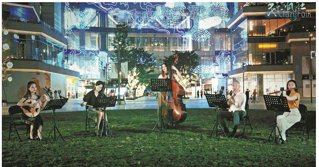
KONSER DADAKAN akan diadakan di Chengdu, Provinsi Sichuan, pada 2 Agustus 2023 itu, mempertemukan musisi tradisional Tiongkok dan musisi klasik.

Gerakan guofeng itu, yang memadukan melodi kuno dengan teknik produksi modern, berhasil menciptakan apresiasi baru terhadap bentuk seni tradisional Tiongkok. Terutama di kalangan generasi muda. Platform media sosial setempat memainkan peran penting dalam memperluas gerakan itu. Membuat musik tradisional lebih mudah diakses dan relevan di era digital. (Guruh Dimas Nugraha)