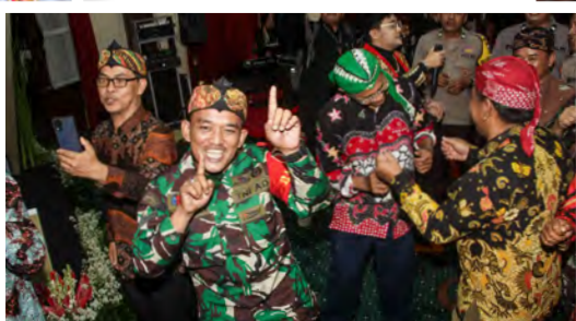
KEGEMBIRAAN FINALIS MENIKMATI HIBURAN