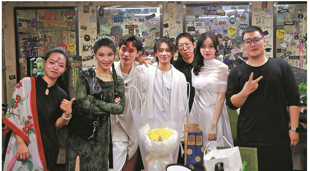
ANGGOTA LITTLE GREEN ONION berpose setelah pertunjukan pada 19 Juni di Mao Livehouse, Beijing.

Menurutnya, banyak anak muda di Tiongkok kini semakin tertarik dengan warisan budaya mereka. Sebagian besar ingin terhubung kembali dengan nilai-nilai tradisional di tengah dunia yang semakin dipengaruhi oleh globalisasi.