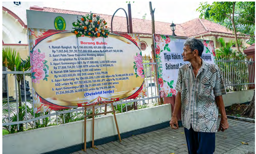
KARANGAN BUNGA di depan kantor Pengadilan Negeri Surabaya sebagai bentuk keprihatinan.