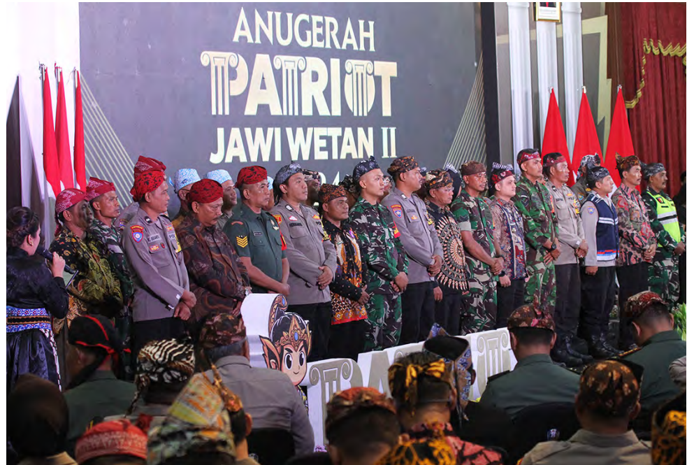
TIGA PILAR 10 desa/kelurahan yang masuk final APJW II 2024 menerima piagam di Gedung Negara Grahadi, Kamis, 24 Oktober 2024.