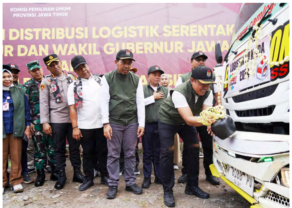
PEMBERANGKATAN surat suara ke Jember oleh Komisi Pemilihan Umum (KPU) Jawa Timur.

“Dari penyelenggara, saya juga nilai sudah bekerja keras dalam menyelenggarakan pemilu ini. Saya mengapresiasi kerja keras penyelenggara pemilu: KPU dan Bawaslu hingga ke tingkat paling bawah,” kata pendeta GKI Darmo Satelit itu. (Ghinan Salman-Michael Fredy Yacob)