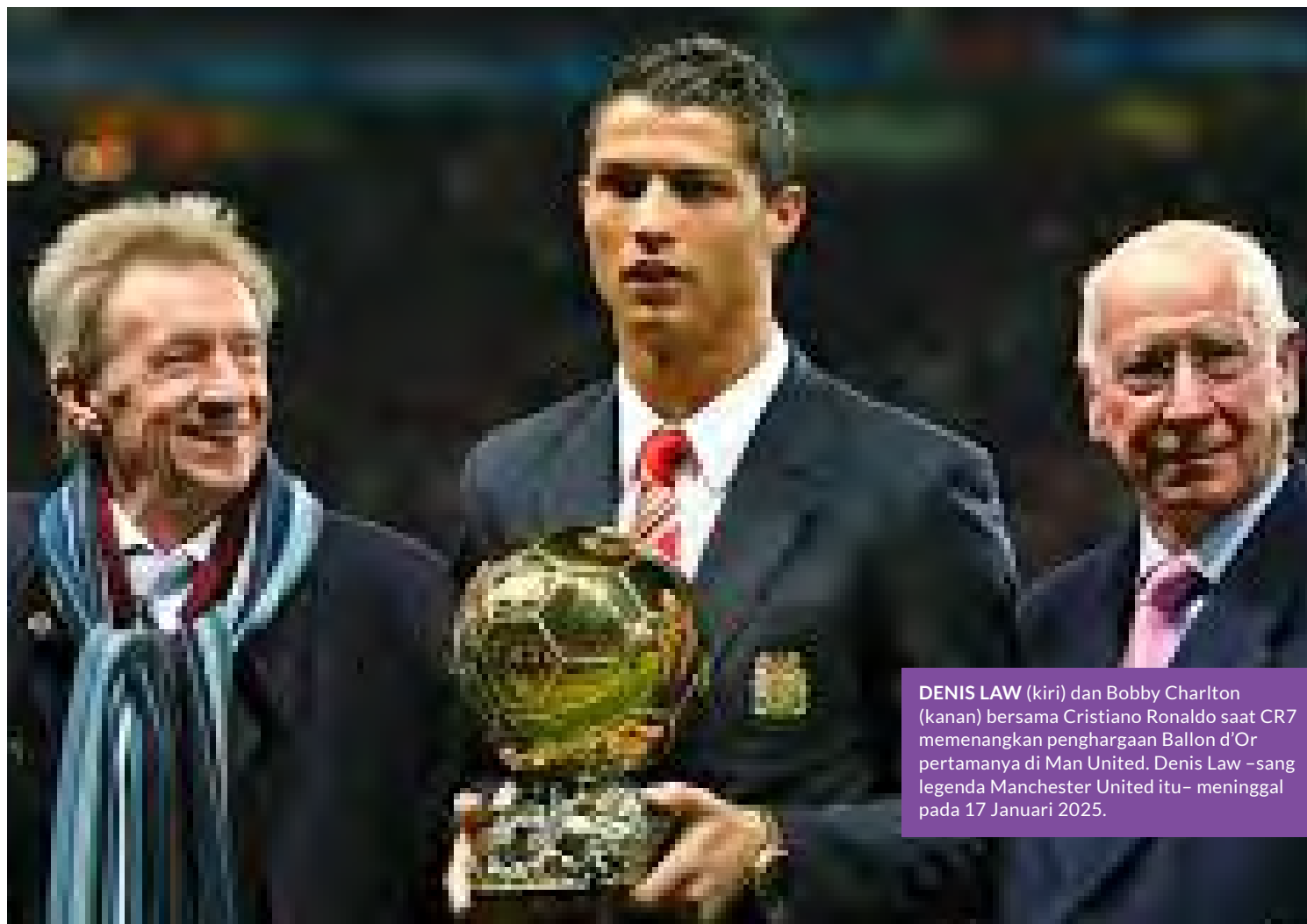
DENIS LAW (kiri) dan Bobby Charlton (kanan) bersama Cristiano Ronaldo saat CR7 memenangkan penghargaan Ballon d'Or pertamanya di Man United. Denis Law –sang legenda Manchester United itu– meninggal pada 17 Januari 2025.