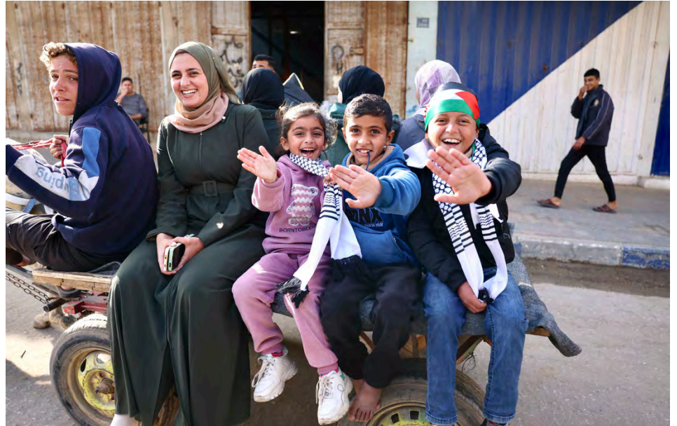
KECERIAAN ANAK-ANAK di Nuseirat menjelang gencatan senjata di Jalur Gaza, 19 Januari 2025.

Dan di Gaza City, warta berparade di jalanan. Mereka menari-nari sembari