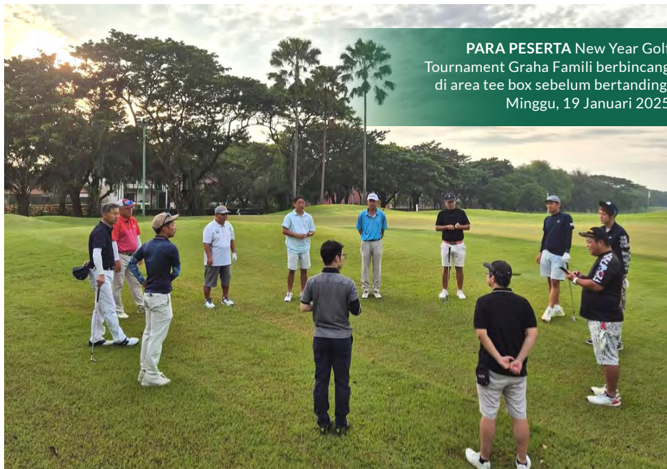
PARA PESERTA New Year Golf Tournament Graha Famili berbincang di area tee box sebelum bertanding, Minggu, 19 Januari 2025

Acara berakhir dengan penuh suka. Semua orang pulang dengan senyuman di wajah mereka, membawa cerita dan kenangan indah. Turnamen golf di Graha Famili Golf bukan sekedar ajang berebut prestasi, tapi juga momen untuk merayakan tahun baru dengan semangat, persahabatan, dan harapan baru pada 2025. (Agustinus Fransisco)