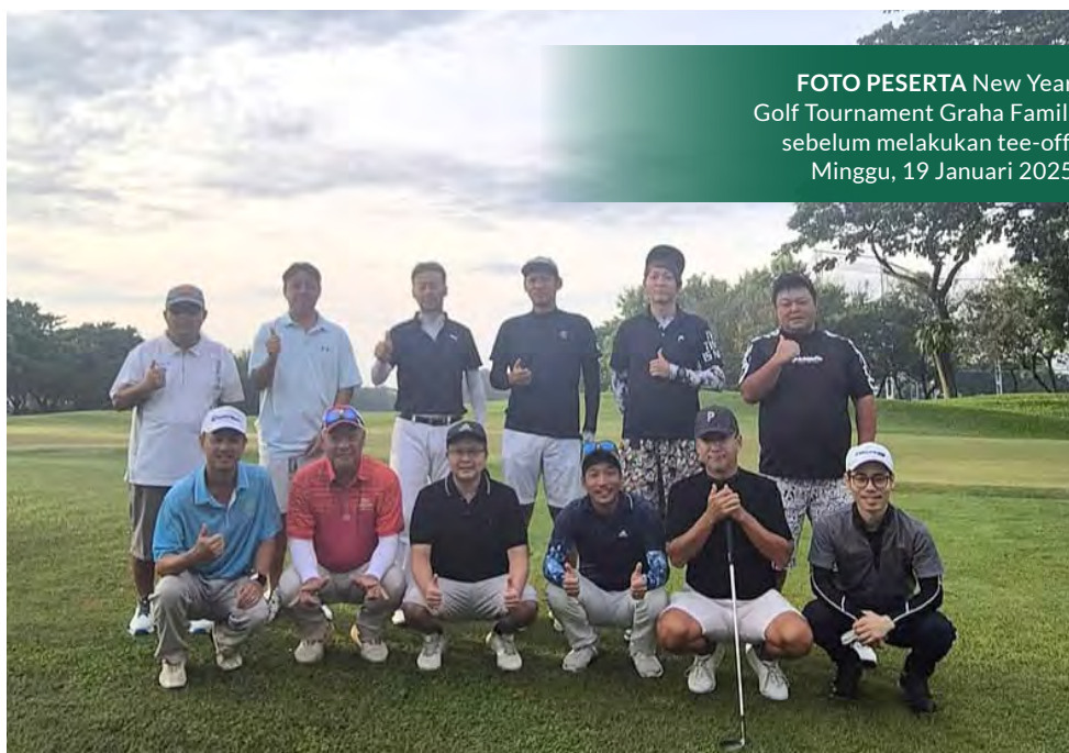
FOTO PESERTA New Year Golf Tournament Graha Famili sebelum melakukan tee-off , Minggu, 19 Januari 2025