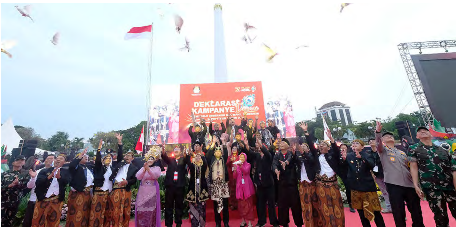
PELEPASAN MERPATI dalam rangkaian Deklarasi Kampanye Damai Pemilihan Gubernur dan Wakil Gubernur Jawa Timur Tahun 2024 di Taman Tugu Pahlawan Surabaya, Selasa, 24 September 2024.

Surokim berharap, sinergi tiga pilar di Jatim tidak hanya menguatkan best practices . Tetapi juga future practices agar tidak ketinggalan zaman. Dengan demikian, para stakeholder tersebut bisa menyongsong perubahan lebih responsif dan adaptif pada pelaksanaan pemilu di masa mendatang. (Ghinan Salman)