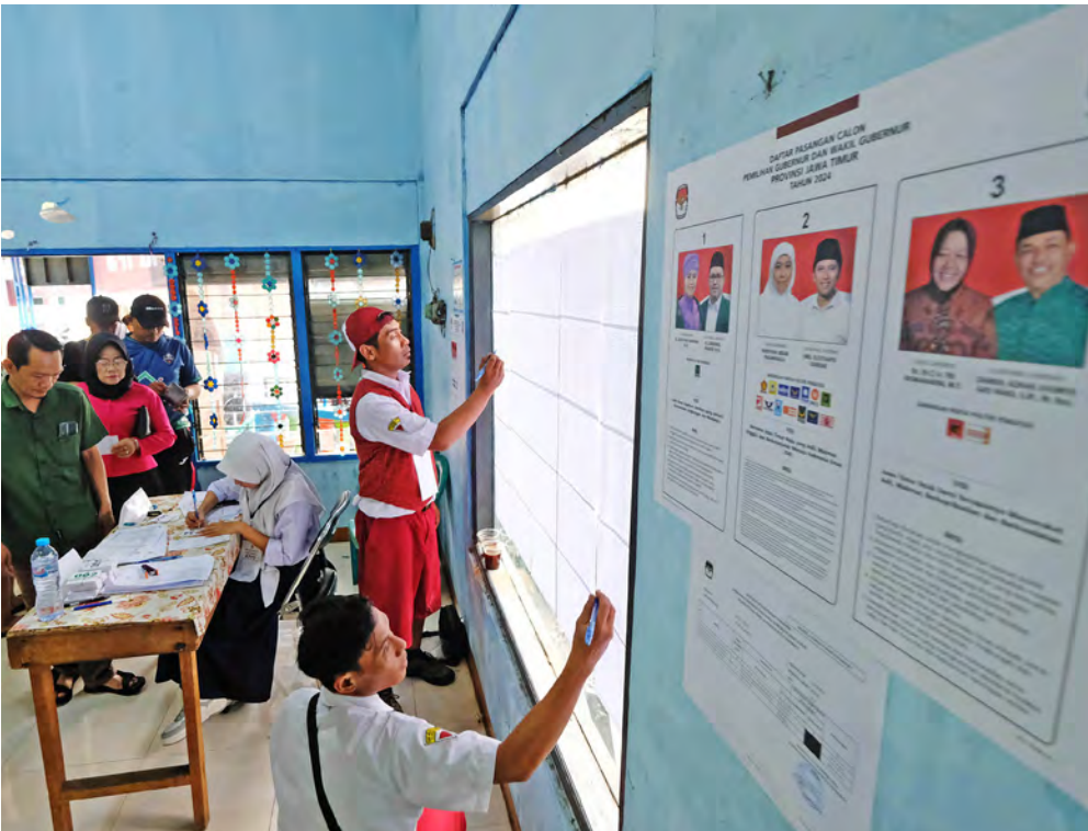
PETUGAS TPS 017 Mojo Surabaya mengenakan seragam sekolah dqri SD hingga SMA.

Y A, pelaksanaan Pilkada Serentak di Jawa Timur berlangsung dengan lancar dan kondusif. Suasana aman dan tertib selama pemilu ini tidak lepas dari peran pemerintah, TNI, dan Polri. Mereka dinilai berhasil menyosialisasikan proses pemilihan dengan efektif kepada masyarakat.