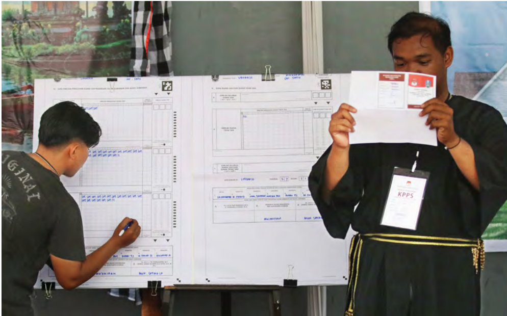
PELAKSANAAN Pilgub Jatim di TPS 01 Magersari Sidoarjo.