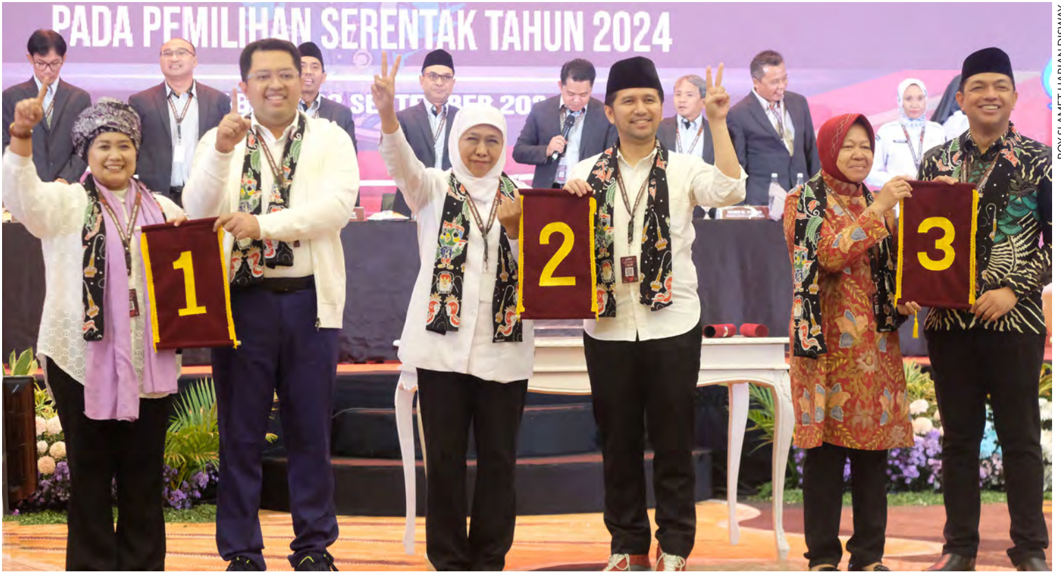
PENENTUAN NOMOR URUT para pasangan calon Gubernur-Wakil Gubernur Jatim.

Respons positif tentang keberhasilan pelaksanaan Pilkada Serentak 2024 datang dari berbagai kalangan. Salah satunya dari para pemuka agama di Jawa Timur. Menurut mereka, pemangku kebijakan di Jatim bisa memanfaatkan komunikasi intens dengan warga.