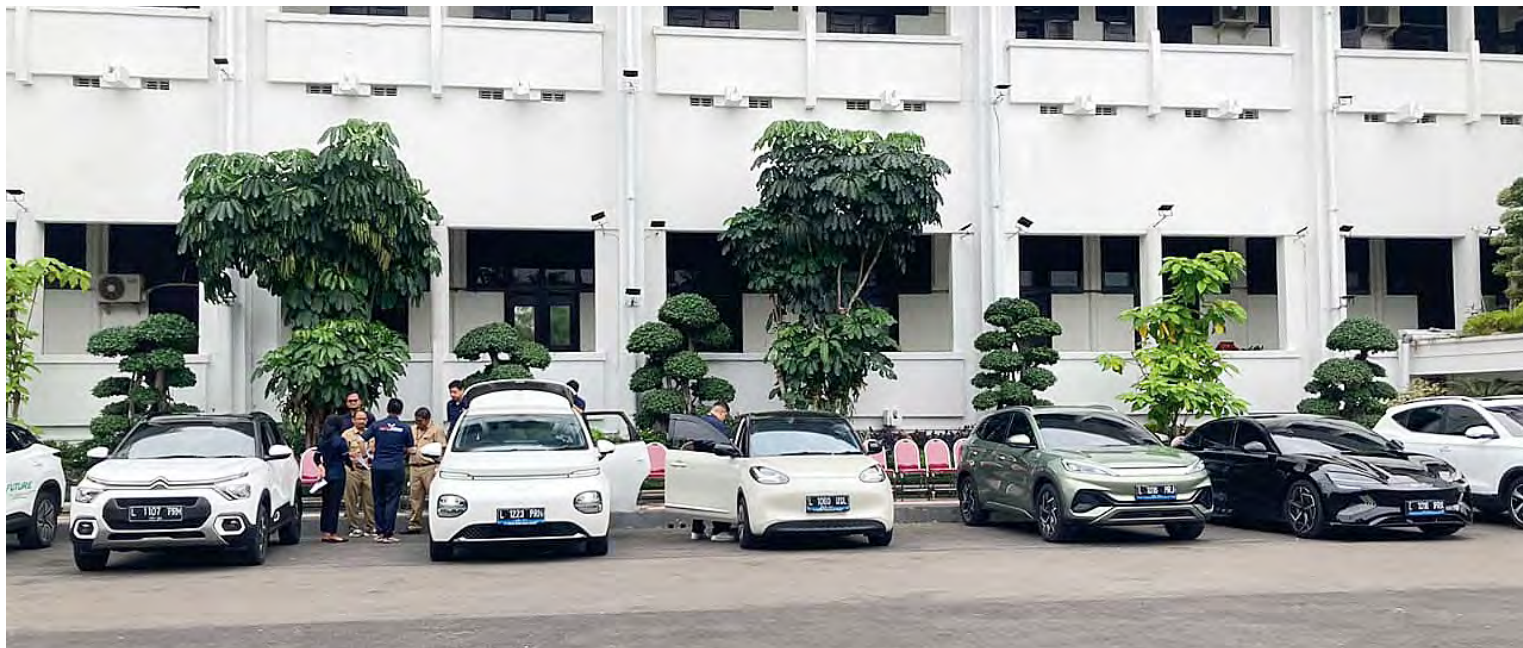
SEJUMLAH MOBIL LISTRIK yang menjadi kendaraan dinas kepala dinas terparkir di halaman Balai Kota Surabaya.

pengadaan mobil listrik sistem sewa ini dinilai lebih menghemat anggaran kira-kira sebesar Rp 9,3 miliar.