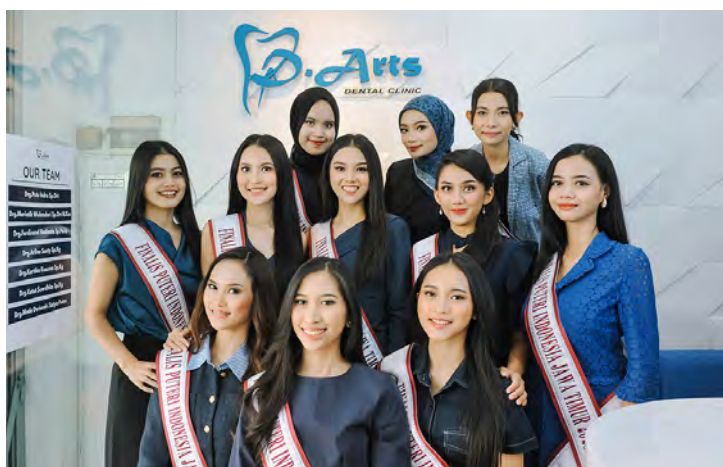
PARA FINALIS Puteri Indonesia Jawa Timur 2025 berkunjung ke D’Arts Dental Clinic, 15 Desember 2024.

Melalui rangkaian acara tersebut, pemilihan Puteri Indonesia Jawa Timur 2025 diharapkan dapat menjadi ajang yang tidak hanya menonjolkan kecantikan semata. Tapi bisa menginspirasi perempuan Indonesia untuk terus berproses, bertumbuh, dan membawa manfaat bagi diri sendiri serta masyarakat. (Guruh D.N.-Afitra Devi)