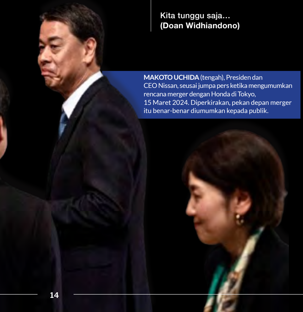
MAKOTO UCHIDA (tengah), Presiden dan CEO Nissan, usai jumpa pers ketika mengumumkan rencana merger dengan Honda di Tokyo, 15 Maret 2024. Diperkirakan, pekan depan merger itu benar-benar diumumkan kepada publik.