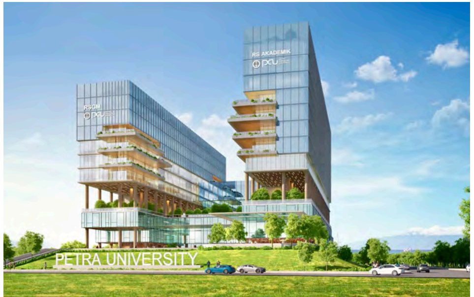
DESAIN Rumah Sakit UK Petra.

Sudah bertahun-tahun seperti itu. Seperti tidak pernah belajar dari kesalahan. “Kami pun pernah punya