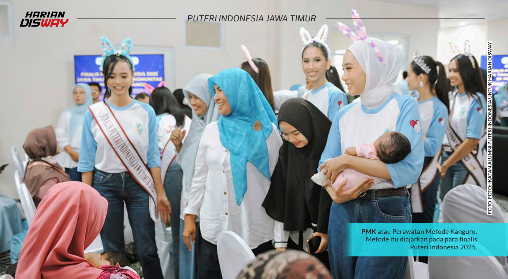
PMK atau Perawatan Metode Kanguru. Metode itu diajarkan pada para finalis Puteri Indonesia 2025.