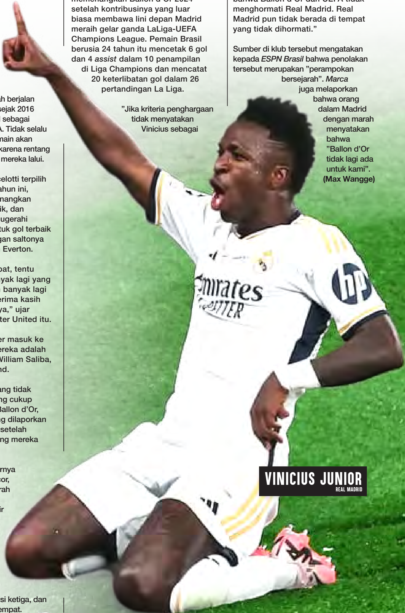
VINICIUS JUNIOR REAL MADRID

bahwa orang dalam Madrid dengan marah menyatakan bahwa "Ballon d'Or tidak lagi ada untuk kami". (Max Wangge)