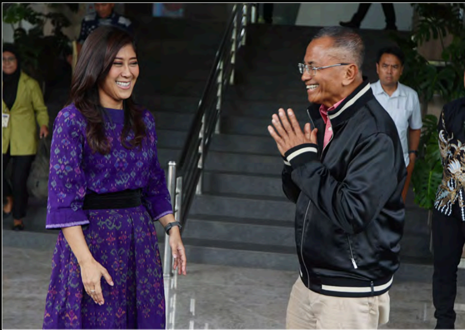
KEAKRABAN Dahlan Iskan dan Menkomdigi Meutya Hafid di kantor Kementerian Komdigi, 18 Desember 2024.

Meutya Hafid juga akan berupaya hadir saat pembukaan turnamen pada 15 Februari 2025 tersebut. Meutya memang ingin selalu mengapresiasi media-media di