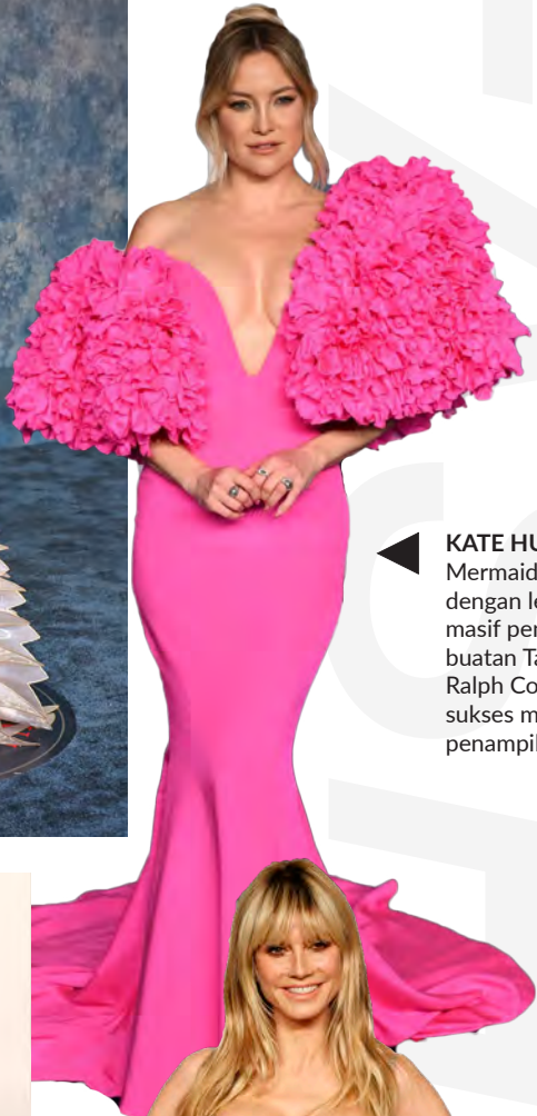
KATE HUDSON Mermaid dress dengan lengan masif penuh ruffle buatan Tamara Ralph Couture sukses mencerahkan penampilan Hudson.