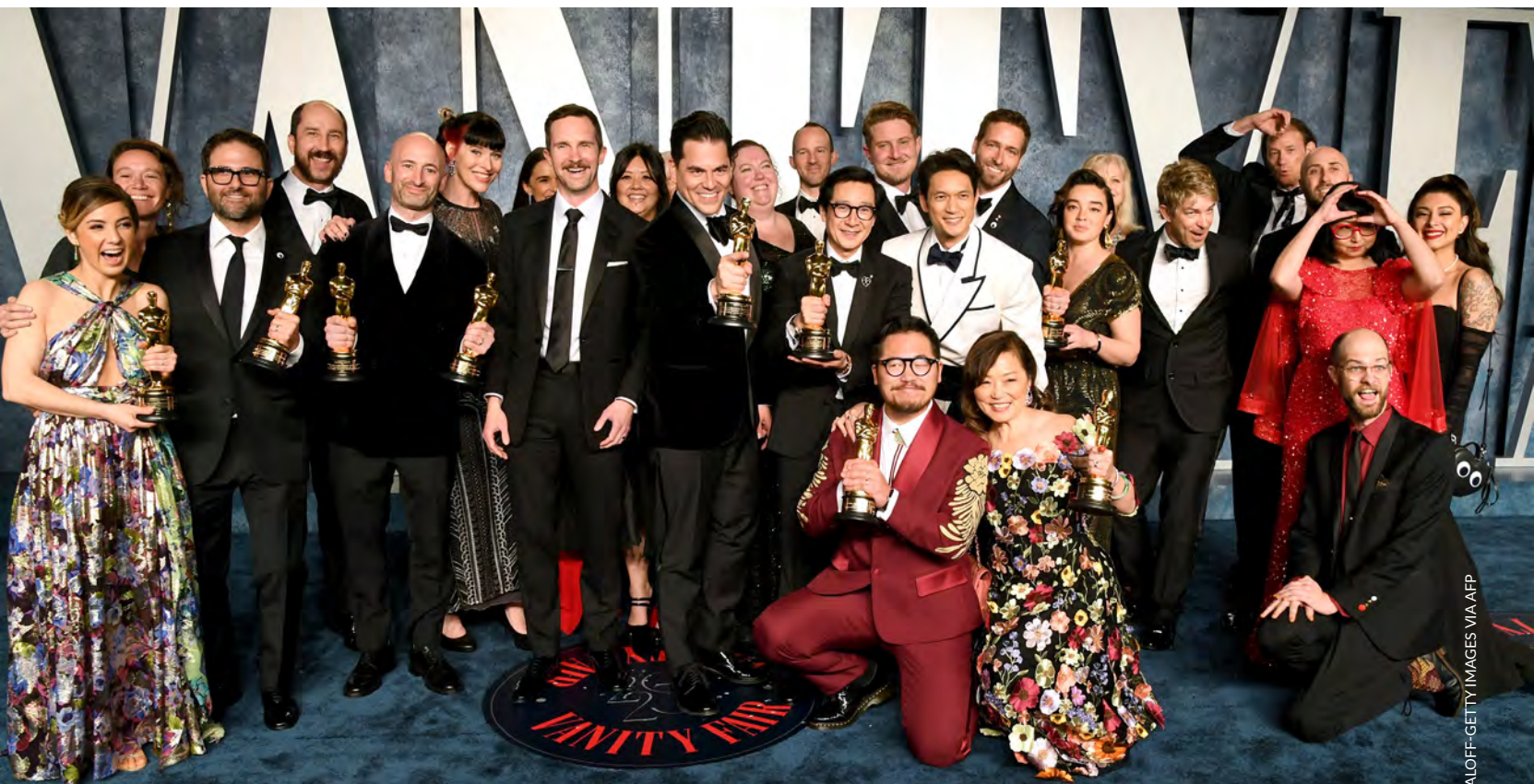
SELURUH cast dan kru Everything Everywhere All at Once berpose di Vanity Fair Oscar Party di Wallis Annenberg Center 13 Maret 2023.

Sebuah adegan mengharukan terjadi ketika pengumuman Best