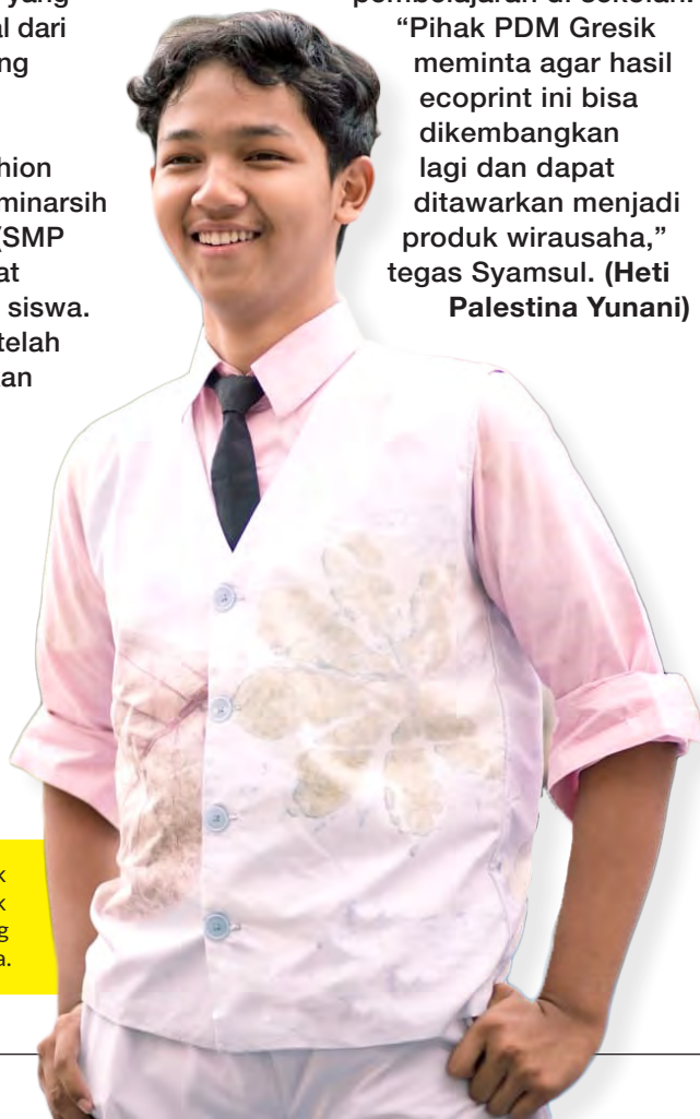
ECOPRINT dalam gaya rompi untuk bartender casino yang sangat cocok dikenakan oleh para cowok yang berjiwa muda.

“Pihak PDM Gresik meminta agar hasil ecoprint ini bisa dikembangkan lagi dan dapat ditawarkan menjadi produk wirausaha,” tegas Syamsul. (Heti Palestina Yunani)