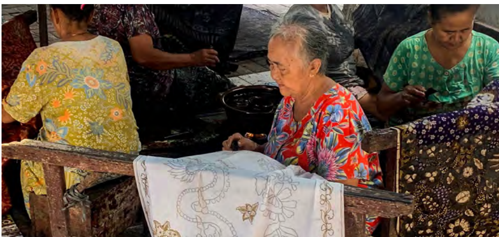
MOTIF NAGA pada mori putih yang sedang digarap para pembatik Sekar Kencana, Lasem.

Setia Membatik Sampai Tua, baca besok... (*)