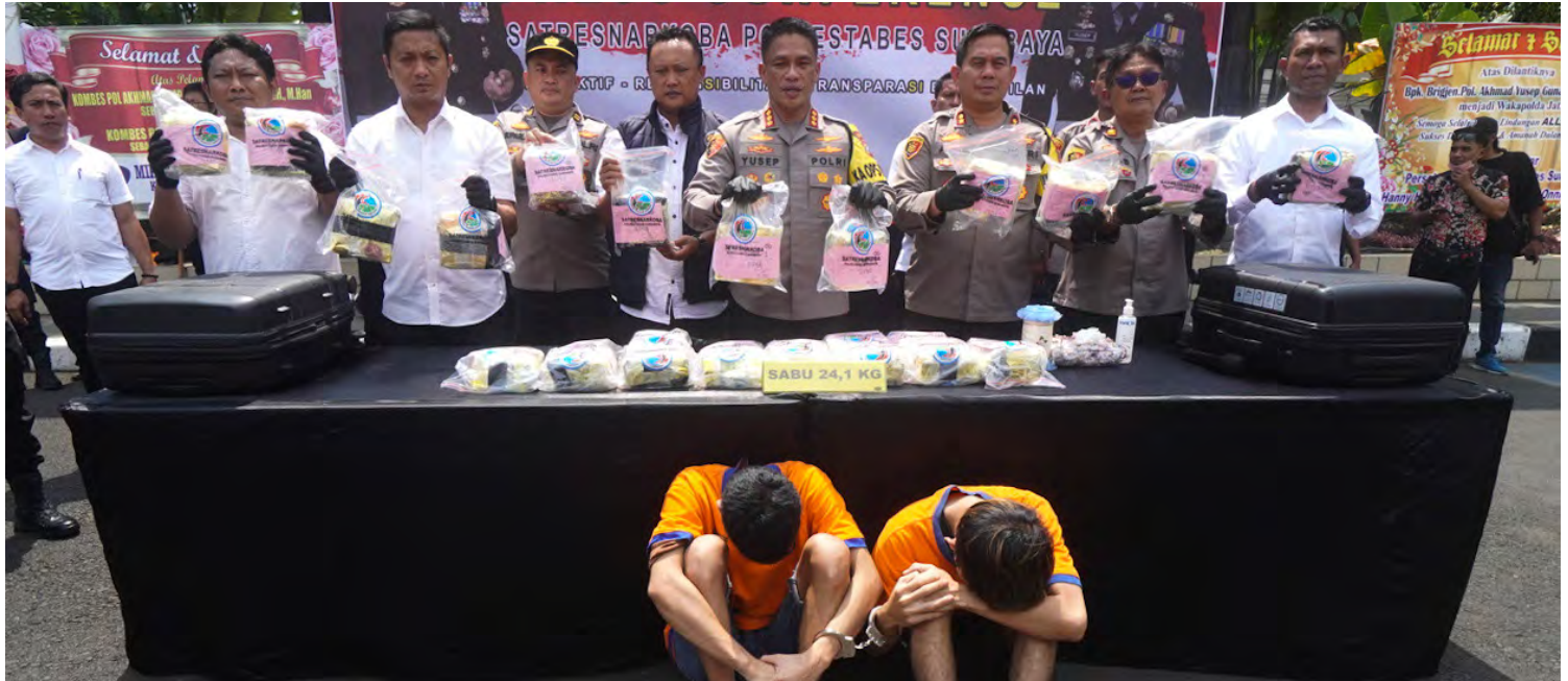
KAPOLRESTABES Surabaya, Kombespol, Achmad Yusep Gunawan (tengah) menunjukkan barang bukti jenis sabu ketika release ungap kasus penyalahgunaan narkoba di Halaman Polrestabes Surabaya, Jawa Timur, Senin (13/3/2023).