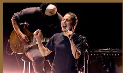
SEMPAT BILANG tidak hadir, Lady Gaga memberi kejutan dengan menyanyikan Hold My Hands , OST Top Gun: Maverick yang dinominasikan untuk Lagu Orisinal Terbaik.

Dalam salah satu segmen, misalnya, ia naik panggung membawa seekor keledai. Binatang itu punya peran besar dalam The Banshees of Inisherin . Ia juga muncul membawa perlengkapan sound , lengkap dengan mikrofon boom . Sebagai intro pengumuman kategori-kategori teknis.