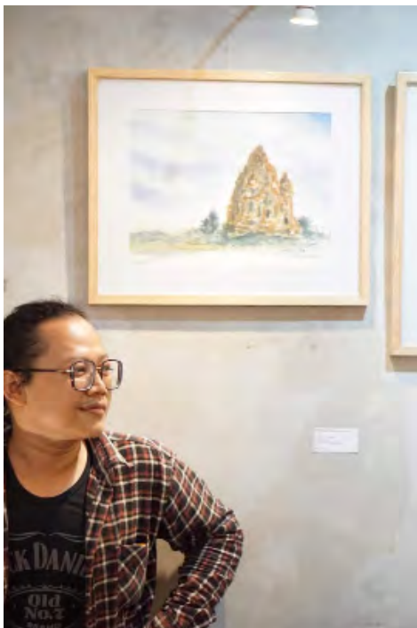
SALAH SATU dari tiga karya Nana Sawitri yang dibuat saat on the spot, berjudul Candi Kalasan.

Seperti dalam liukan bagai ombak dalam Mini Series Gerak dan Mini Series Gerak 2 (20x24 cm, 2023) yang menjadi lekukan tubuh ikan dan siripnya, Mini Series Inti