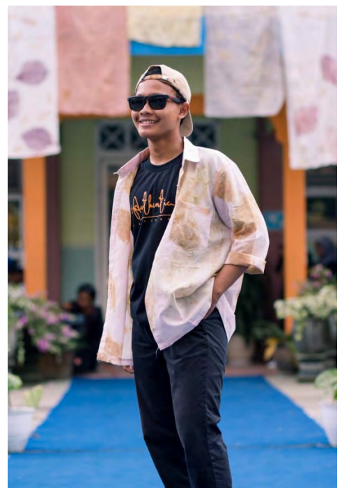
CASUAL OUTER Basic with Ecoprint dirancang oleh enam siswa untuk bisa dipakai.