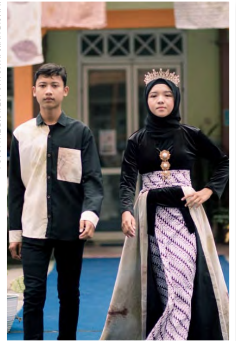
ENAM SISWA merancang busana sarimbit dalam tema Casual with Javanese of Ecoprint .

"Jika melihat potongannya, busana sarimbit ini dirancang untuk bisa dipakai dalam acara resmi seperti pertunangan, pernikahan, dan pesta lainnya," terang Samsul yang lebih dikenal dengan nama populee Soul Esto itu.