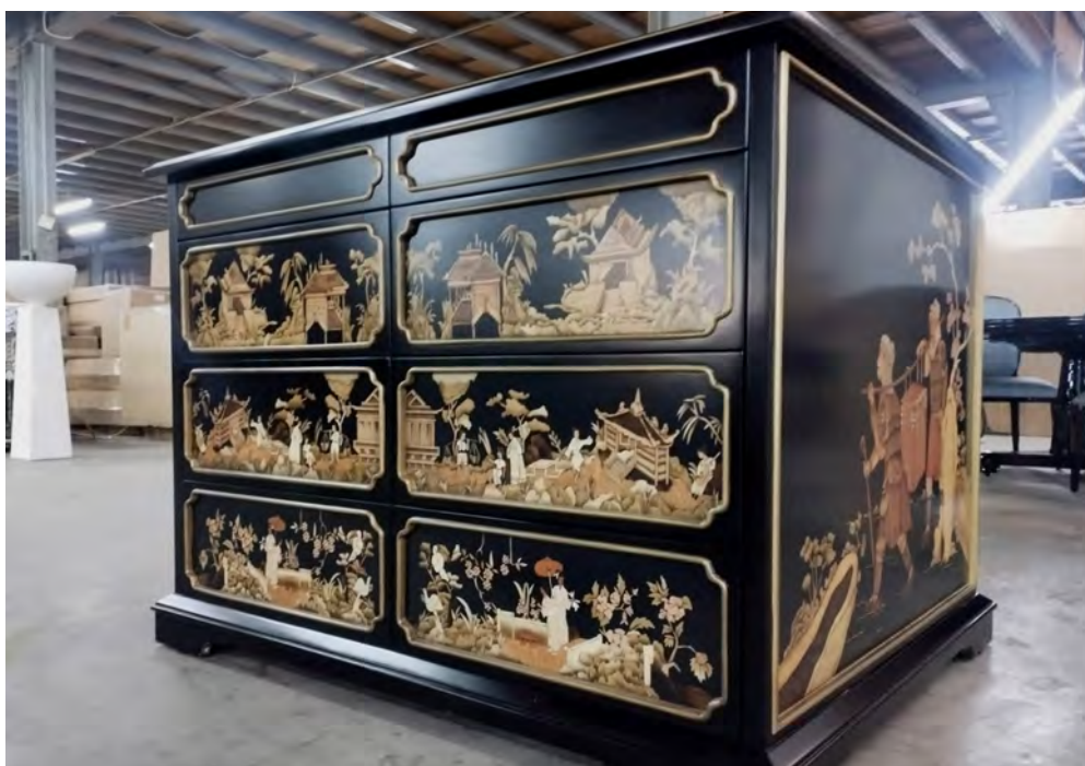
MEJA TV berhias lukisan seni ukir kayu garapan Saniharto Enggalhardjo yang terpajang di area pabrik.

“Karena prinsipnya, Indonesia ini bisa hebat. Tidak cuma jadi tukang jahit saja. Nothing is impossible ,” tandas perempuan jebolan Purdue University itu. (Mohamad Nur Khotib)