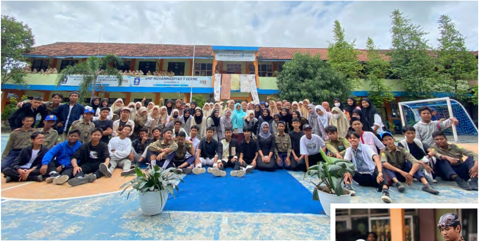
SEMUA SISWA kelas IX SMP Muhammadiyah 7 Cerme yang ujian praktik foto bersama kepala sekolah selepas acara Spemaju Fashion Day bertema The Stunning and Beautiful of Ecoprint yang digelar di halaman sekolah.

batik ecoprint-nya saya ajarkan cara steaming,” papar Syamsul.