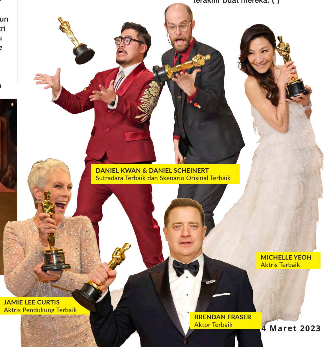
DANIEL KWAN & DANIEL SCHEINERT Sutradara Terbaik dan Skenario Orisinal Terbaik

MENGHARUKAN , Ke Huy Quan memeluk Harrison Ford saat filmnya memenangkan Best Picture. Mengulang adegan 39 tahun silam dalam film Indiana Jones and the Temple of Doom .