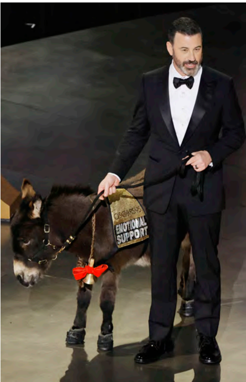
BANYAK IDE GIMMICK, Jimmy Kimmel muncul di panggung membawa seekor keledai, elemen penting dalam film The Banshees of Inisherin .