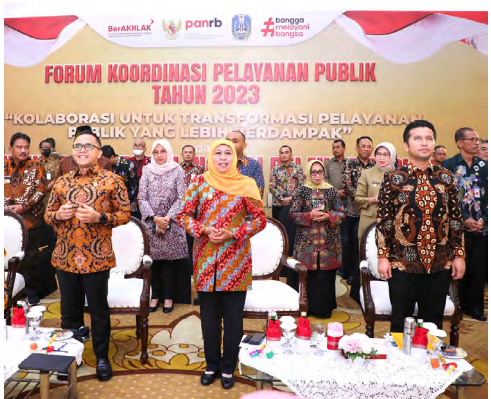
MENTERI PAN-RB Abdullah Azwar Anas (kiri), Gubernur Jawa Timur Khofifah Indar Parawangsa, dan Wakil Gubernur Jatim Emil Dardak dalam acara Forum Koordinasi Pelayanan Publik.

Khofifah membeberkan strategi Pemprov Jatim dalam menghadapi ketidakpastian berbagai fenomena global. Yakni, melaksanakan IKI (inisiatif, kolaborasi, dan inovasi). "Untuk menjalankan IKI, para ASN