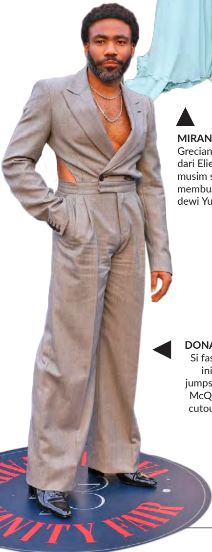
DONALD GLOVER Si fashion forward ini mengenakan jumpsuit Alexander McQueen beraksen cutout pada perut.